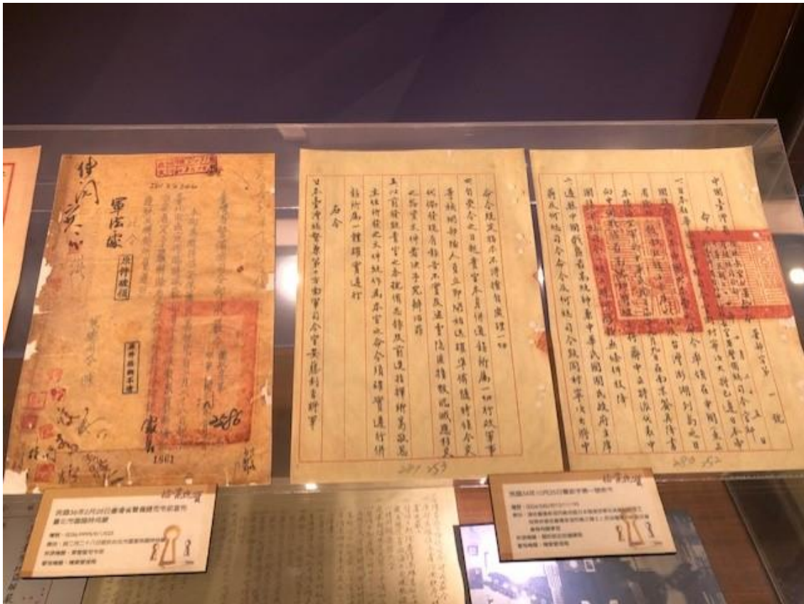
新莊聯合辦公大樓北棟1F 國家檔案典藏展